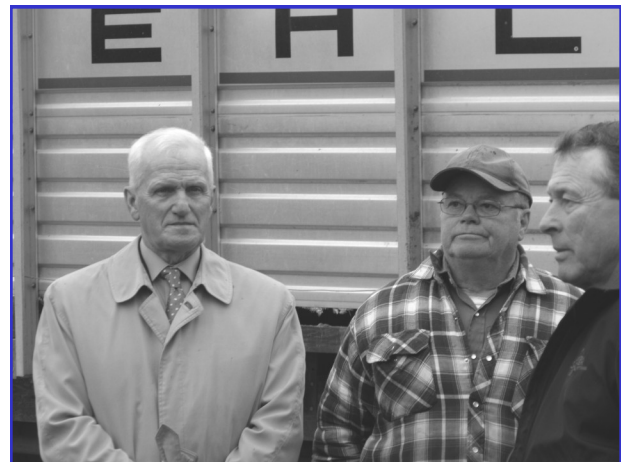
Gordon O'Connor a participé à un événement à Carp avec des électeurs pour exprimer son appui envers le projet de loi d'initiative parlementaire visant à abolir le registre coûteux et inefficace des armes d'épaule.